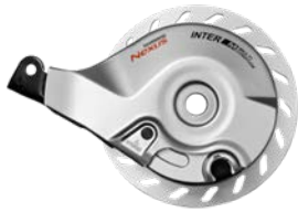
Billede 1, BR-C3000-R, Baghjul