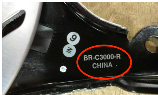
Billede 4, eksempel på markering af type