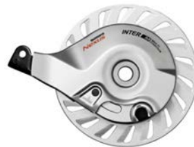
Billede 2, BR-C3010-R, Baghjul