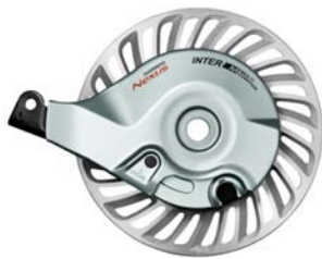
Billede 3, BR-C6000-R, Baghjul