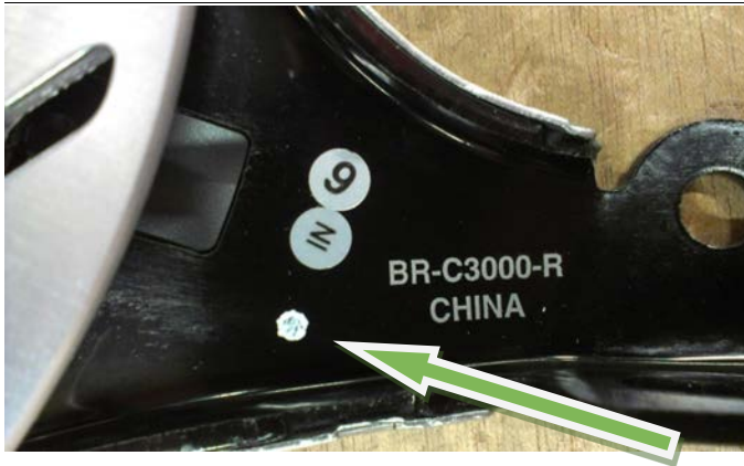
Billede 5, markering med hvid prik